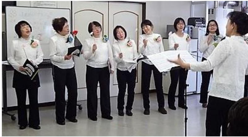
ソプラノパート～メゾパート～アルトパート (お一人入らなかった、かんにん！👏👏)